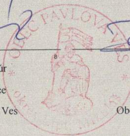
Obec Pavlova Ves

8) Doplniť meno, funkciu a názov spoločnosti podľa Obchodného alebo iného registra.